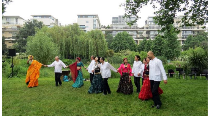
© Les voyous et les voyelles

Une bande éclectique de joyeux drabkis et de danseuses-sagatteuses d'influences diverses (tribales, orientales, tziganes, flamenco ...) vous entraîne sur des rythmes venant d'Égypte, du Maghreb, du Moyen Orient, des Balkans, au cœur d'un Orient baigné par des influences ottomanes, andalouses, indiennes...etc. Le temps d'une rencontre, les danseuses s'affrontent, leurs langages se confrontent, dialoguent, s'harmonisent et fusionnent au son des darboukas, daff et sagattes.