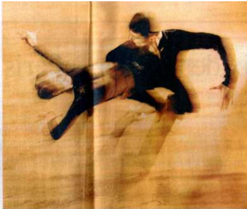
La danse, une pratique au service du bien-être et de la convivialité.

La danse ne sert pas qu'à développer la convivialité. Elle devient un loisir au service de la forme et du mieux-être. Après la « Biodanse », place à la « Balletothérapie » (5). Importée d'Amérique latine, cette discipline aurait pour vertu de libérer nos tensions tout en nous aidant à retrouver le tonus. Combattre le stress, c'est aussi le credo de la