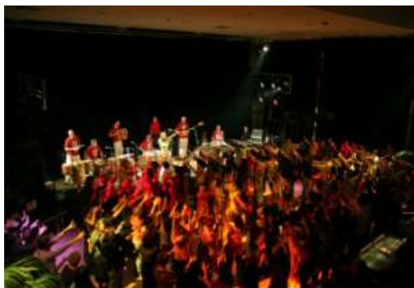
© Difé Kako - photo Patrick Berger

Un spectacle interactif où public et artistes ne cessent de communiquer. Tout le monde peut participer au bal antillais et renouer ainsi avec l'esprit de la fête dans la lignée des zouks. Une musique chaude, carnavalesque, une musique pour danser inspirée des traditions antillaises, africaines et brésiliennes qui se mêlent aux "standards" revisités pour la plus grande joie du public, amené par les danseuses de Difé Kako à devenir des ambassadeurs de la danse.