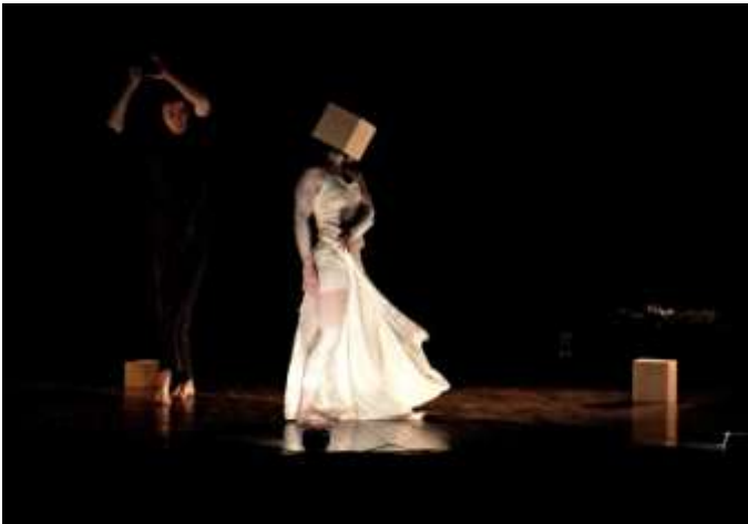
danseuse - chorégraphe.